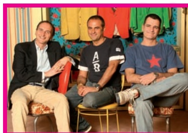
Mai dire grande fratello 1