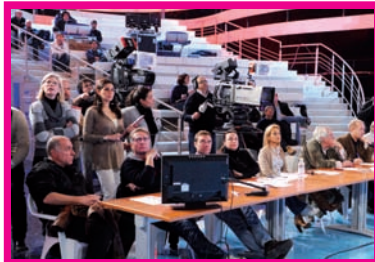
Ciao Darwin 6: istruzioni per l'uso