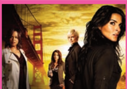
Women's Murder Club