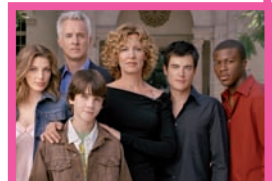
Jack & Bobby