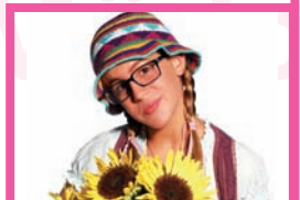
Il Mondo di Patty