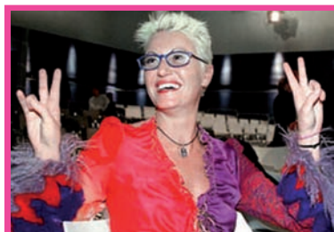
Grande Fratello 1